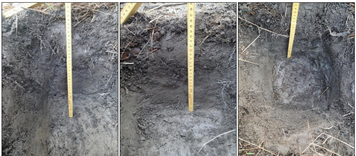
Koekuopat nro 6, 9 ja 11.