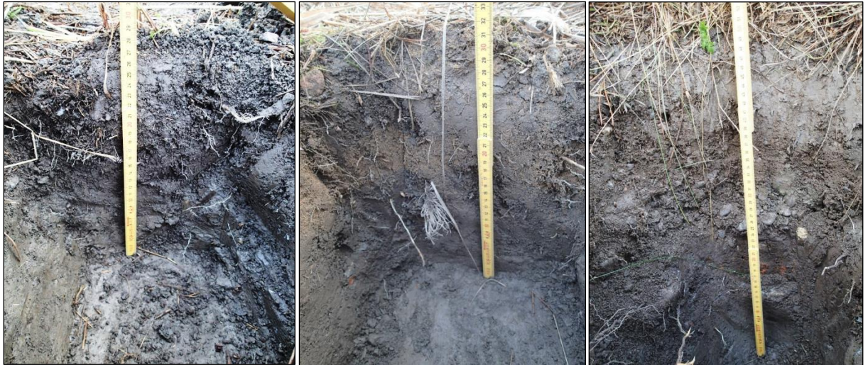
koekuopat 12, 13 ja 14.