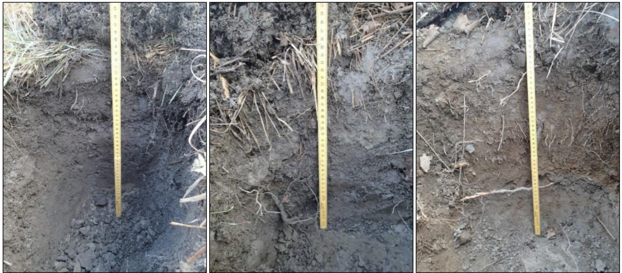
Koekuopat nro 1, 2 ja 4.