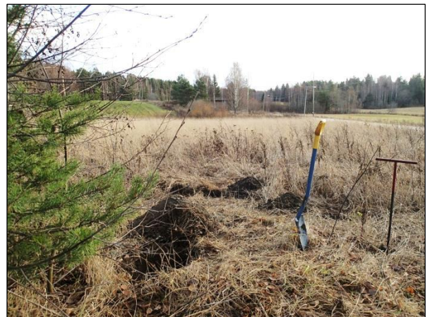
Koekuopituksella tutkittua aluetta vasemmalla kuvattuna koilliseen ja oikealla kaakkoon.