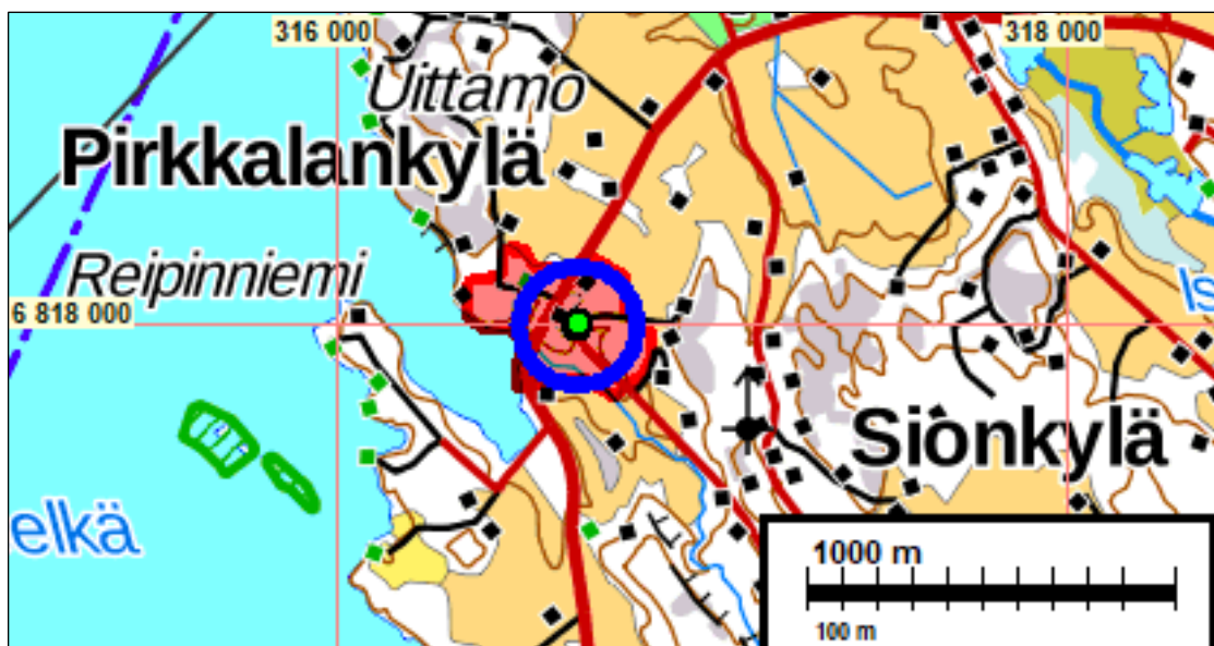
Tutkimusalue on vihreällä sinisen ympyrän sisällä.

Tulokset Muuntamon ja kaapelilinjojen kohdalla ei todettu kiinteää muinaisjäännöstä.