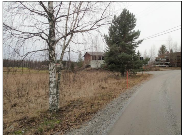
Tutkimusaluetta tien reunassa, vasemmalla kuvattuna lounaaseen ja oikealla kuvattuna länteen.